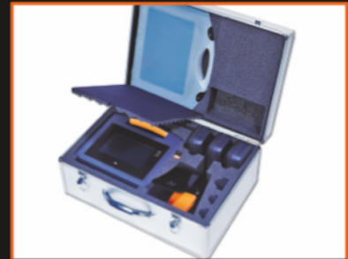
Komplettes Laser-Set und Zubehör