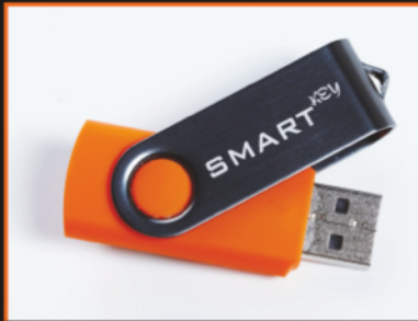
Datenbankhandbuch und USB-Stick in einem