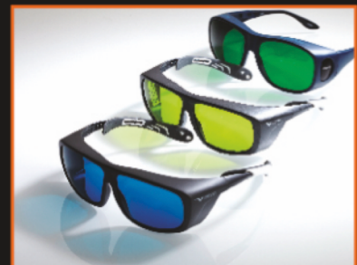
Schutzbrille für den Arzt und den Patienten

Mehr als zehnjährige Erfahrungen mit Lasertechnik Niedrige Betriebskosten Kleine Abmessungen und kompaktes Design Flexibilität und optionale Parameter